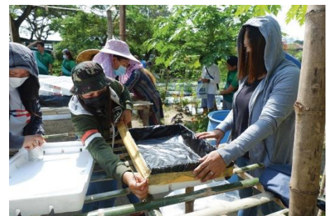
水耕栽培の技術を学ぶ女性農業者と Zamboanga City West ローターアクトクラブ会員

南アジア: バングラディッシュの Islamabad ローターアクトクラブは、「Project Beacon」においてローターが支援する学校を改装し、コロナ禍で困難に直面している生徒たちに個別指導やガイダンスを行い、教材を提供しました。