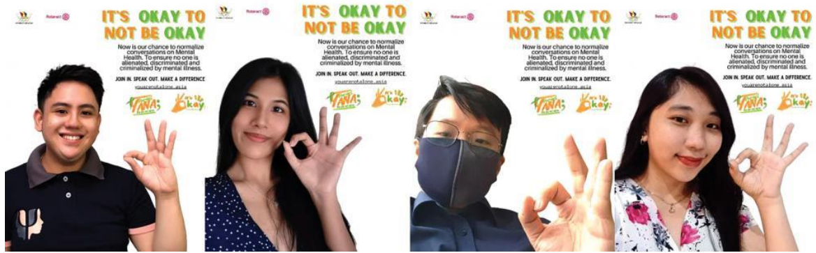
南アジアのローターアクトが行ったメンタルヘルスイニシアチブでのデジタルポスター

複数クラブによる活動: 東南アジアのローターアクトクラブが最優秀賞を受賞しました。これらのクラブによるメンタルヘルスのイニシアチブ「You Are Not Alone」は、地元での広報活動や、自殺、ネットいじめ、トラウマ、うつに関するバーチャル形式の啓発ワークショップが含まれ、インパクトがもたらされた人は 50,000 人以上に上ります。