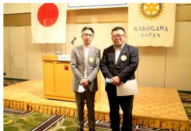
▲芝本会員に 地区より委嘱状