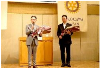
▲城会長・久後幹事挨拶