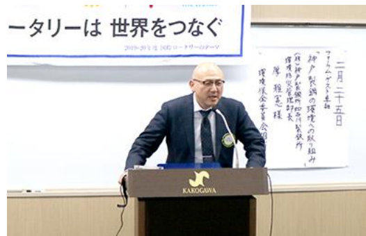
▲志賀会員退会挨拶