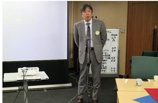
▲宮崎環境保全委員長