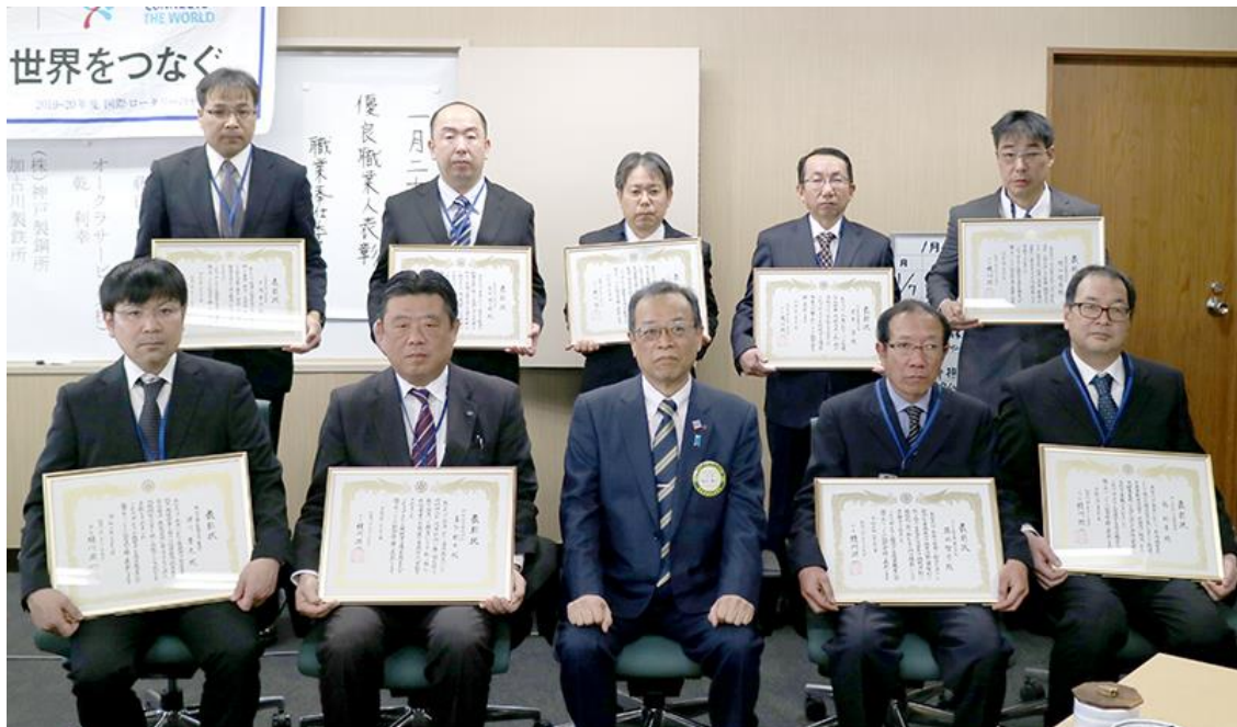
▲優良職業人表彰を受けられた皆様