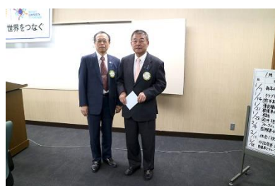
▲第2回米山功労者マルチプル 大山会員