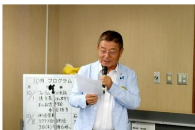
▲大山米山記念奨学会委員長