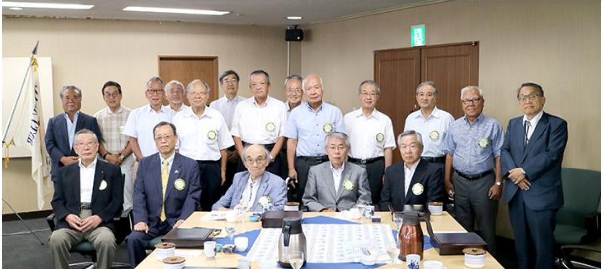
▲尚齒のお祝いを受けられた会員の皆様