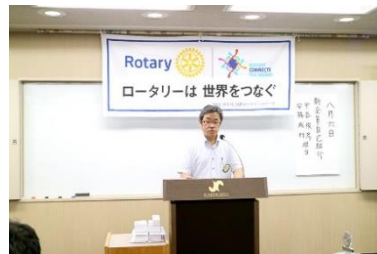
▲安福会員自己紹介