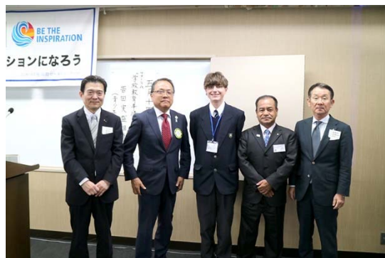
▲アーサー君をお迎えして